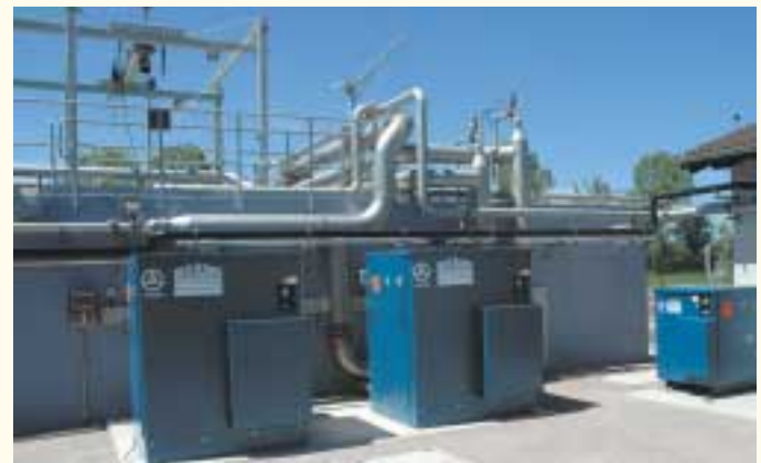
Belebungsbecken mit Gebläsestation

Das Denitrifikationsbecken ist dem Nitrifikationsbecken vorgeschaltet. Im Nitrifikationsbecken werden die Stickstoffverbindungen unter Luftzufuhr in Nitrat umgewandelt. Über eine Rezirkulation gelangt das Abwasser in das Denitrifikationsbecken, wo das Nitrat in gasförmigen Stickstoff umgewandelt wird. Hier ist neben der feinblasigen Belüftung zur Sauerstoffversorgung der Bakterien ebenfalls ein Rührwerk installiert, das während der unbelüfteten Phasen Ablagerungen im Denitrifikationsbecken verhindert. Der Sauerstoffeintrag in das Belebungsbecken wird über den Sauerstoffgehalt im Nitrifikationsbecken geregelt.