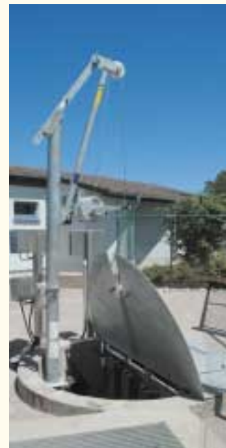
Pumpenschacht – hier kommt das Abwasser an

Im Pumpenschacht mündet der Stauraumkanal, in dem das Abwasser von Waldmössingen der Kläranlage zugeführt wird. Der Kanal kommt in 5 m Tiefe an. Im 6,3 m tiefen Pumpenschacht sind 3 Tauchmotorpumpen mit einer Leistung von je 15 l/s installiert. Mit einer Pumpe wird der Trockenwetterzulauf zur Kläranlage gepumpt. Für die Regenwassermenge von 25 l/s werden 2 Pumpen parallel betrieben. Die 3. Pumpe dient als Reserve.