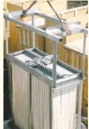
Membranpaket beim Einbau

Mit der neuen Kläranlage in Membrantechnologie kann nun das Wasser weiter in Waldmössingen geklärt werden. Im gereinigten Wasser werden sich künftig Fische und Enten wohl fühlen. Der Abfluss der Anlage fließt nämlich auch in die Teiche beim Tiergehege.