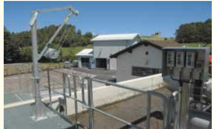
Denitrifikations- und Belebungsbecken

Das Denitrifikationsbecken ist dem Nitrifikationsbecken vorgeschaltet. Im Nitrifikationsbecken werden die Stickstoffverbindungen unter Luftzufuhr in Nitrat umgewandelt. Über eine Rezirkulation gelangt das Abwasser in das Denitrifikationsbecken, wo das Nitrat in gasförmigen Stickstoff umgewandelt wird. Hier ist neben der feinblasigen Belüftung zur Sauerstoffversorgung der Bakterien ebenfalls ein Rührwerk installiert, das während der unbelüfteten Phasen Ablagerungen im Denitrifikationsbecken verhindert. Der Sauerstoffeintrag in das Belebungsbecken wird über den Sauerstoffgehalt im Nitrifikationsbecken geregelt.