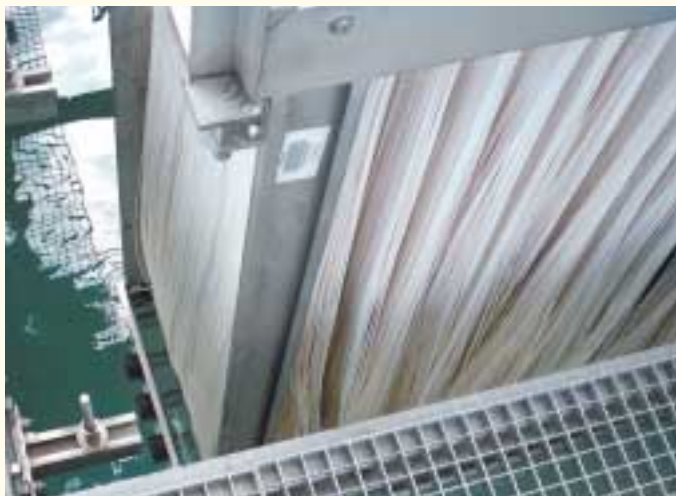
Ein Membranpaket bei der Montage

Im Gegensatz zu konventionellen Kläranlagen, in welchen der Belebtschlamm durch Sedimentation von Wasser getrennt wird, wurden in Waldmössingen Membranen eingebaut, um die erhöhten Anforderungen der Einleitwerte in den Vorfluter Heimbach erfüllen zu können.