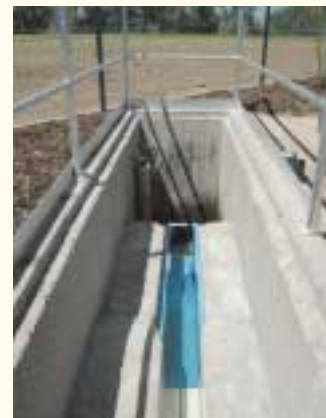
Der Ablauf der Kläranlage

Durch die vollständige Abtrennung der Biomasse, die in herkömmlichen Nachklärbecken nicht erreicht wird, verbessert sich die Reinigungsleistung und das Wasser im Ablauf der Kläranlage ist weitgehend frei von Viren und Bakterien. Die Ablaufqualität ist dadurch hygienisch unbedenklich und das Wasser kann direkt in Badewasser eingeleitet werden.