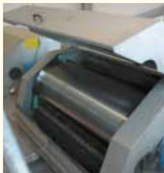
Zwei Trommelsiebe reinigen das Wasser mechanisch

Die Kläranlage funktioniert nach dem Verfahren der vorgeschalteten Denitrifikation. Hierzu verfügt die Anlage über zwei getrennte Behandlungsbecken, dem Denitrifikationsbecken und den Belebungsbecken oder auch Nitrifikationsbecken.