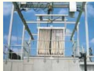
Membranpaket beim Einbau

Organische Verunreinigungen im Rohabwasser werden hier von Mikroorganismen unter Verbrauch von Sauerstoff zu neuer Biomasse, Wasser und Kohlendioxid umgesetzt.