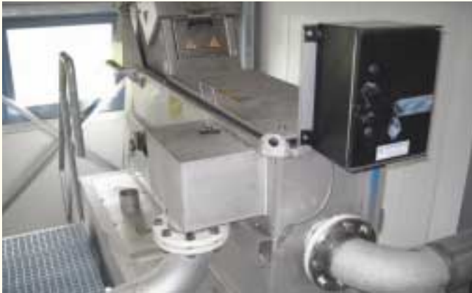
Die Rechenanlage dient der mechanischen Abwasserreinigung

Aufgrund der erhöhten Anforderungen der Membrananlage an die Rohabwasserqualität muss die Mechanische Vorreinigung gegenüber konventionellen Kläranlagen hochwertiger ausgeführt werden. In Waldmössingen wurden diese Anforderungen durch den Einbau einer Kompaktanlage Rechen – Sandfang und zwei nachgeschalteten Trommelsieben realisiert. Der Rechen hat eine Spaltweite von 5 mm und ist mit einer Waschpresse zur Behandlung des Rechengutes ausgerüstet. Der Sandfang hat eine Belüftung und verfügt über eine automatische Räumereinrichtung. Die beiden parallel betriebenen Spaltsiebe haben eine Spaltweite von 0,5 mm und sind ebenfalls mit einer Waschpresse ausgerüstet.