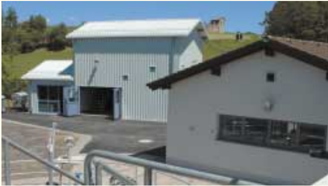
Schaltzentrale und Rechengebäude

Im ehemaligen Rechengebäude der Kläranlage wurde der Technikraum der Membranbiologie untergebracht. Im Einzelnen besteht die Einrichtung aus: