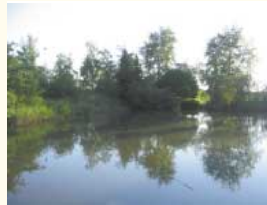
Das gereinigte Wasser fließt in Badewasserqualität direkt in den Schönungsteich beim Tiergehege oder in den Heimbach

Das gereinigte Abwasser wird über den bestehenden Ablaufkanal wahlweise direkt in den Heimbach oder in den Schönungsteich beim Tiergehege abgeleitet. Während der Trockenzeit fließt im Heimbach nur wenig Wasser, wodurch sein Ökosystem besonders gefährdet ist. Durch den Einsatz der neuen Membranbiologie wird die Wasserqualität im Heimbach erheblich verbessert, da der Ablauf der Kläranlage Badewasserqualität erreicht.